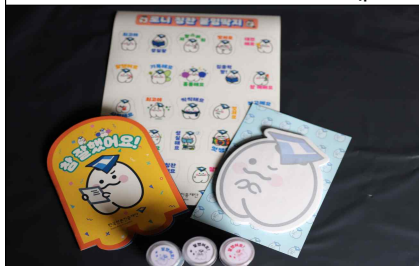
▲ 칭찬북, 스티커, 메모지